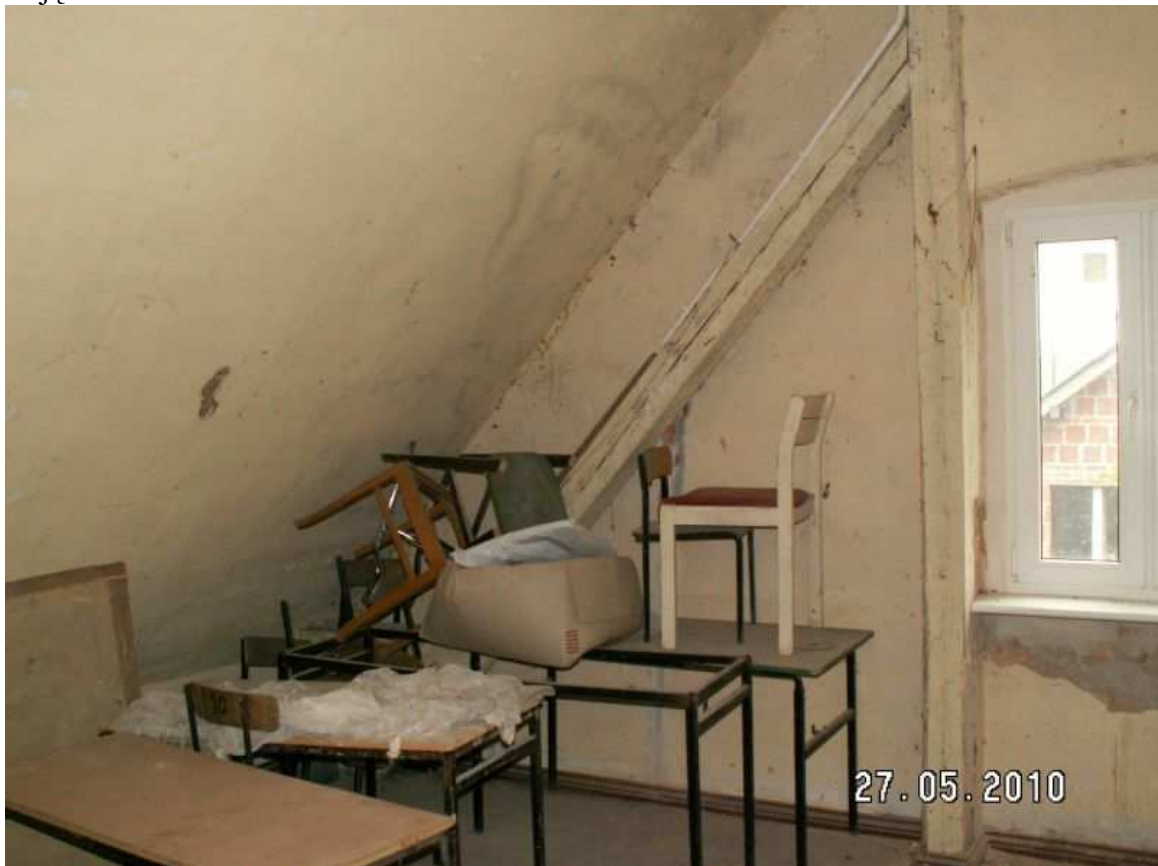
Zdjęcie Nr 1 Poddasze

Na poddaszu znajdują się nie użytkowane obecnie pomieszczenia, które wymagają remontu. Stan obecny obrazują poniższe zdjęcia.